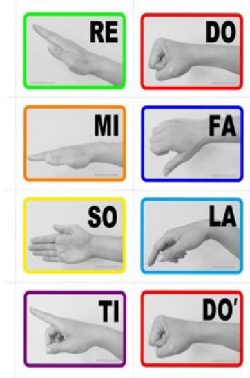
شكل (٣) يوضح إشارات اليد الدالة على النغمات لـ جون كيروين

بنفس إشارة اليد ولكن في الارتفاع الصحيح لليد للتعبير عن النغمة في طبقتها الصوتية الصحيحة