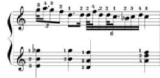
شكل رقم (٤) يوضح كيفية أداء الحنية م (٢٩)