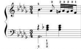
شكل رقم (٦) يوضح كيفية أداء الحلية م (٢٤)