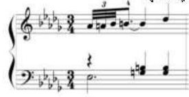
شکل رقم (٩) یوضح کیفیة أداء الحلیة م (٢٧)