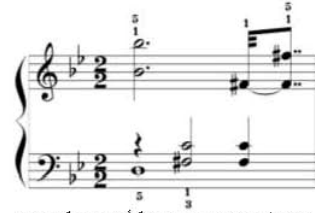
شكل رقم (١٢) يوضح كيفية أداء الحلية م (٣٨)

- وجود حلية الأريجييو في اليد اليمنى م (٣٨ ، ٣٩ ، ٤٠ ، ٤١) على مسافة الأوكتاف وأيضًا على مسافة الأوكتاف المتتالية من م (٥٤ - ٥٥) ومن م (٨٨ : ٩٢) مع وجود القوس اللحني فيراعي عند الأداء تحقيق أكبر قدر ممكن من الترابط فلا يترك الأصبع الخامس النغمة إلا إذا ترك الأصبع الأول النغمة الهابطة من مسافة الأوكتاف والعكس.