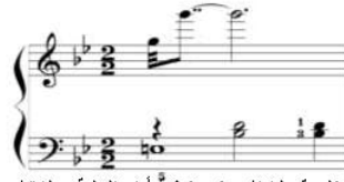
شكل رقم (١١) يوضح كيفية أداء الحنية م (٣٦)