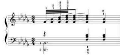
شکل رقم (٧) یوضح کیفیة أداء الحلیة فی الیـد الیمنی م (٣٦)