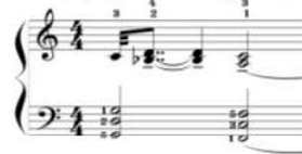
شكل رقم (٢) يوضح كيفية أداء الحلية م(٣)