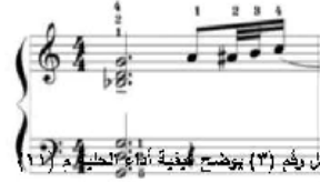
شكل رقم (٣) يوضح كيفية أداء الحنية م (٣١)