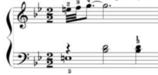
شكل رقم (١٠) يوضح كيفية أداء الحنية م(٢٢)