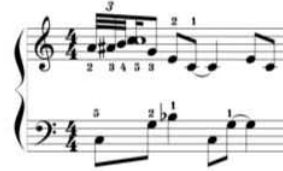
شكل رقم (٥) يوضح كيفية أداء الحنية م (٤١)