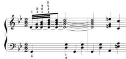
شكل رقم (١٣) يوضح كيفية أداء الحلية م (٥٨ ، ٥٩)

- وجود حلية الأريجييو على التآلفات الرباعية الممتدة من خلال الرباط الزمني من م (٥٨ : ٥٩) وتكرر في م (١١٨ : ١١٩) ومن م (٦٠ : ٦١) وتكرر من م (٦٦ : ٦٧) ومن م (١٢٠ : ١٢١) ومن م (١٢٦ : ١٢٧) ويتبع نفس الإرشادات السابقة لحلية الأريجييو مع مراعاة وجود الرباط الزمني واستمرار نغمات الحلية حتى انتهاء زمن العلامتين ومراعاة أن تؤدي اليد اليسرى النغمة المفردة ثم المسافة أو التآلف الهارموني الثلاثي بسلاسة ومرونة لليد والأصابع حتى لا تعوق اليد اليمنى عند أداء الحلية ، وتقترح الباحثة أداء التصرين التقني من كتاب Rossmanoi الجزء السابع صفحة (١٤) ، (١٥).