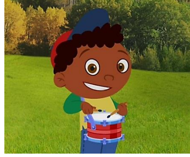
شكل (٥) يوضح الجزء الخاص بالنشاط الثالث (آلات الباند الإيقاعية)