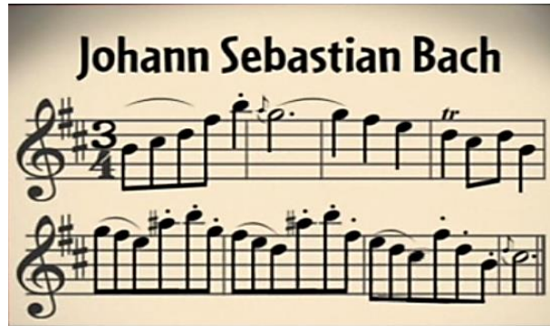
شكل (٦) يوضح جزء من المدونة الموسيقية للموسيقى المصاحبة للنشاط الثالث