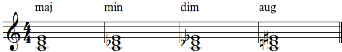
شكل يوضح انواع التآلفات الثلاثية

٤ - التآلف الزائد: وهو ما كانت فيه ثالثته كبيرة وخامسته زائدة.