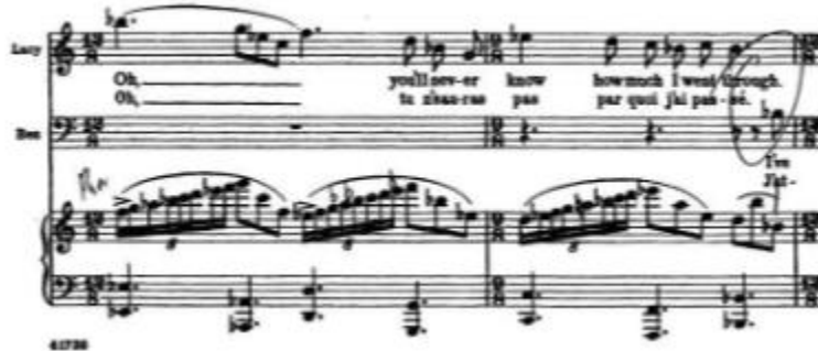
شكل رقم (١) يوضح الخط الغنائي المترابط

أولاً: استخدام الأداء التقليدي المعروف كما في الأوبرا الكلاسيكية وما بعدها حيث وضع الصوت في سقف الحلق بشكل متكامل لإحداث الرنين واتصال الجمل من خلال التنفس الطبيعي دون ضغوط كما في صوت لوسى .