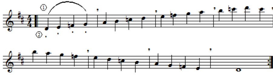
شكل رقم (٩) يوضح سلم ري الكبير

- ثم يقوم الطلاب بعزف أربيج سلم ري الكبير