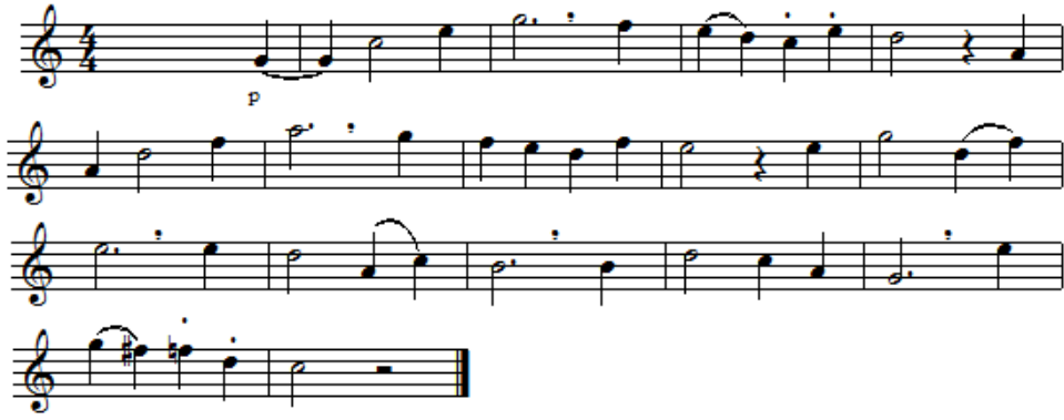
شكل رقم (٤) يوضح تمرين من كتاب kohler

- يستمع الطلاب الى تمرين 35 من كتاب kohler