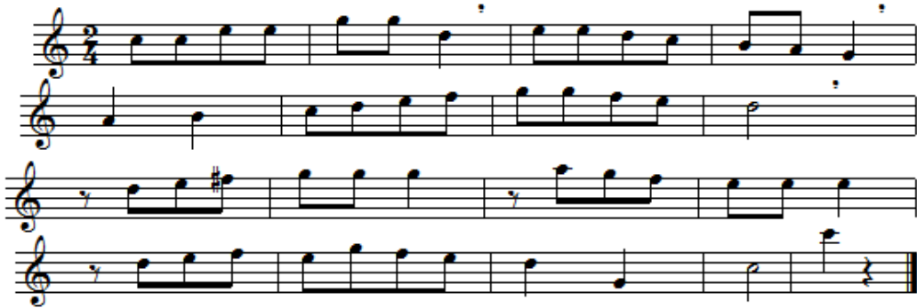
شكل رقم (٧) يوضح تمرين من كتاب kohler