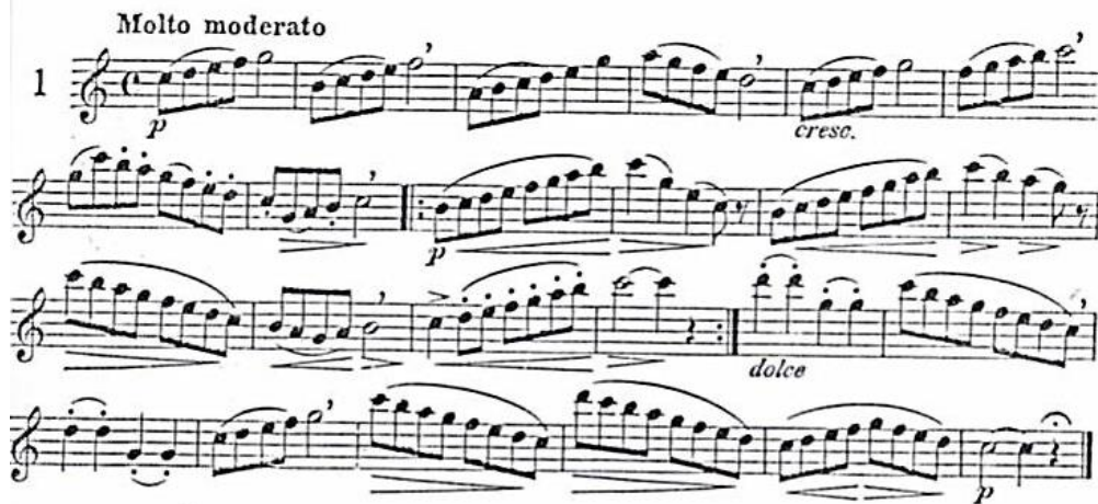
شكل رقم (٨) يوضح تمرين ١ من كتاب forty-four studies giuseppe gariboldi