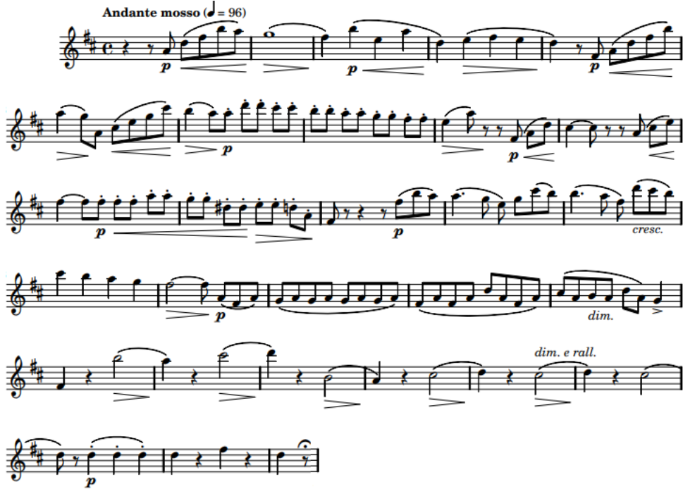
شكل رقم (١١) من كتاب (Six duos faciles Giuseppe Gariboldi Op. 145)