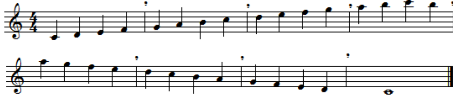
شكل رقم (٥) يوضح سلم دو الكبير

- يتم عزف سلم دو الكبير علي ٢ أكتاف بالشكل التالي :