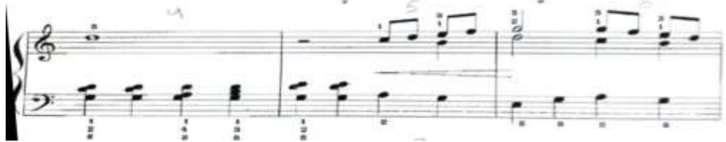
شكل رقم (٢) يوضح م ( 4 ، 5 ، 6 ) من المؤلفه

للتغلب على هذه الصعوبة مراعاة نزول النغمات المزوجه في نفس الوقت وبنفس القوه عن طريق تجهيز الاصابع وهبوطها من أعلى في شكل افقي بمساعدة الرسغ والساعد .