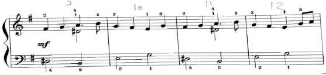
شكل رقم (٧) يوضح م ( 9 : 12 ) من المؤلفه

للتغلب على هذه الصعوبة التأكيد على الاحتفاظ بزمن النغمة الممتدة حتى إذا لم تكن هناك نغمات متحركة مع مراعاة عدم شد اليد بالنسبة للصوت الممتد ليتسنى عزف الصوت المتحرك بليونته وسلاسه مع التركيز على ان لا يرتفع الاصبع قبل نهاية مده عزفه .