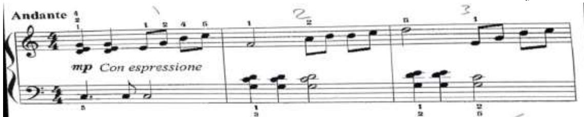
شكل رقم (1) يوضح م (1، 2، 3) من المؤلفه

للتغلب على هذه الصعوبه يؤدي التألف مفرط بنفس أرقام الاصابع المدونه ثم يجمع وتغزف النغمات بشكل خفيف حتى لا تطغي على اللحن مع مراعاة تساوي قوه النغمات ونزول الاصابع في نفس الوقت