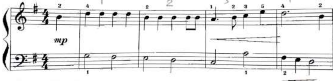
شكل رقم (٦) يوضح م ( ١ : ٤ ) من المؤلفه