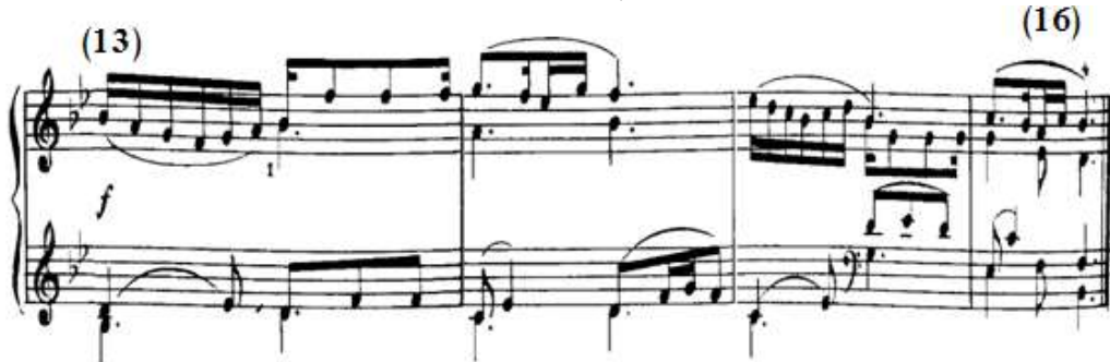
شكل رقم (٩)

جاءت إعادة للفكرة الأولى من م(١) - (٤) في صوت قوى f، والشكل التالي رقم (٩) يوضح ذلك.