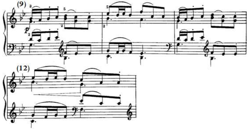
شكل رقم (٨)

الفكرة الثانية من م(٩) - (١٢) في الدراسة الثالثة