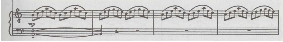
التآلفات الأربيجية مازورة رقم (١-٤)

اعتمدت المصاحبة على التآلفات الأربيجية المتكررة الصاعدة هابطة بشكل متواتر، مع استخدام الإيقاعات العريضة والنغمات الممتدة في صوت الباص للمصاحبة mezzo piano مع بداية الغناء، جاء في بعض الأحيان المصاحبة في نفس الشكل الأربيجي مع استخدام إيقاع o في الباص وتغيير التعبير إلى Mezzo Forte مع الحفاظ على الشكل والأداء مع الغناء. أخذت المصاحبة نفس الشكل الأربيجي ولكن بتعبير MF تماشياً مع الأداء القوي للصوتين وإعطاء ثراء لحني للأداء.