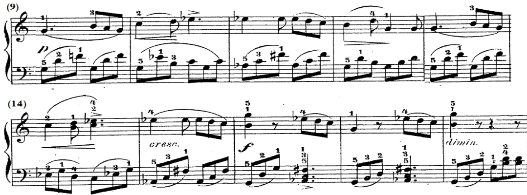
شكل رقم (١٠)

جاء اللحن باليد اليمنى في سلم صول/ص قائم على مسافات لحنية ومسافات هارمونية خاضعة لأقواس لحنية مختلفة الأطوال، وتستمر اليد اليسرى في النموذج الإيقاعي الذى يحتوى على أربيجات ونغمات تألفات منفردة ومتصلة تتكرر بالتصوير ويتخللها تألف هارموني وتكراره، والشكل التالي يوضح ذلك.