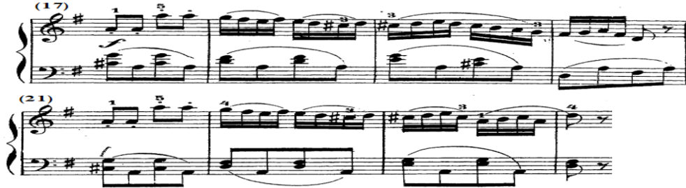
شكل رقم (١٦)

جاء لحن العبارة الأولى من م (١٧) - (٢٠) في اليد اليمنى قائم على نغمة متكررة منقطعة وأوكتافها يليها نغمات سلمية هابطة وصاعدة متصلة، ويتكرر ذلك بالعبارة الثانية من م (٢١) - (٢٤)، وجاءت المصاحبة في اليد اليسرى قائمة على أداء متصل لمسافة هارمونية يليها نغمة مفردة متصلين ويتكرر ذلك بالتبادل، والشكل التالي يوضح ذلك.