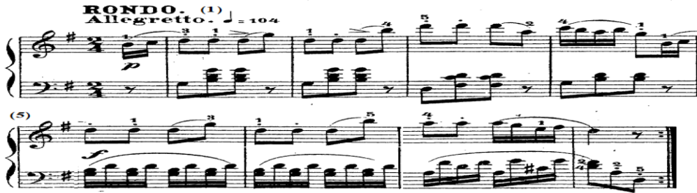
شكل رقم (١٤)

الفكرة الأولى A: من أناكروز (١) - م (٨) تنتهي بقفلة تامة في سلم صول/ك. بدأ اللحن في اليد اليمنى بأناكروز في سلم صول/ك وجاء قائم على مسافات لحنية متقطعة Staccato وخاضعة لأقواس لحنية قصيرة Slur وعلامة الضغط القوي accent، وجاءت مصاحبة اليد اليسرى من م (١) - (٤) في نموذج إيقاعي متكرر قائم على نغمة مفردة يليها تألف هارموني وتكراره وينتهي بسكتة، ثم تتغير المصاحبة في م (٥)، (٦) إلى في نموذج إيقاعي متكرر من مسافة هارمونية ونغمة مفردة بالتبادل متصلين، وتغيرت في م (٧) المصاحبة إلى ألبرتي باص لتنتهي في م (٨) على تألف منفرد هابط، والشكل التالي يوضح ذلك.