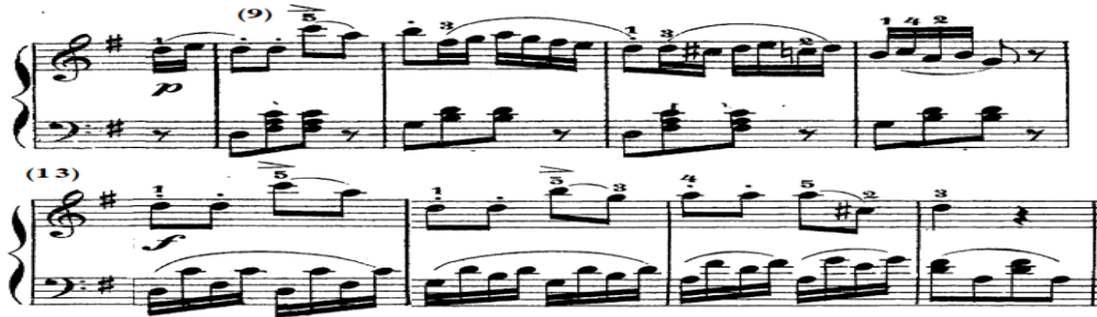
شكل رقم (١٥)

Legato في م (١٠)، (١١)، واستمرت مصاحبة اليد اليسرى كما جاءت في الفكرة الأولى مع الاختلاف بظهور مصاحبة الألبرتي باص من م (١٣-١٥)، والشكل التالي يوضح ذلك.