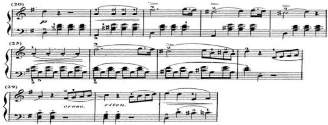
شكل رقم (٥)

الجملة الثانية بالفكرة الثانية B من م(٢٠)- (٣١) في الحركة الأولى