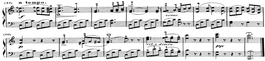
شكل رقم (١٣)

الفكرة الثالثة A2: من م(٤٣) - (٥٦) تنتهي بقفلة تامة في سلم دو/ك. الجملة الأولى من م(٤٣) - (٥٠) جاءت إعادة حرفية للجملة الأولى بالفكرة الأولى من (١) - (٧) ولكن تؤدي بصوت قوى f ، والجملة الثانية من م(٥١) - (٥٦) جاءت إعادة بالتصوير للجملة الثانية بالفكرة الأولى من م(٩) - (١٦) ولكن بالتصوير، وتنتهي الفكرة الثالثة على تألف هارموني ثلاثي ممتد بقفلة تامة في سلم دو/ك، والشكل التالي يوضح ذلك.