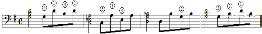
شكل رقم (٢)

- ألبرتي باص Alberti Bass متصل في اليد اليسرى، كما جاء طوال الفكرة الأولى. يتطلب أدائها انتباه العازف لتغيير المسافات اللحنية في الألبرتي باص من م(٥)- (٧) وظهور علامات عارضة، مع أهمية عدم الفصل بين النغمات وتدوير يده اليسرى للحصول على الأداء المتصل، ويلتزم بتقريب الأصابع الموضح، وتقترب الباحثة التدريب التالي على أداء الألبرتي باص.