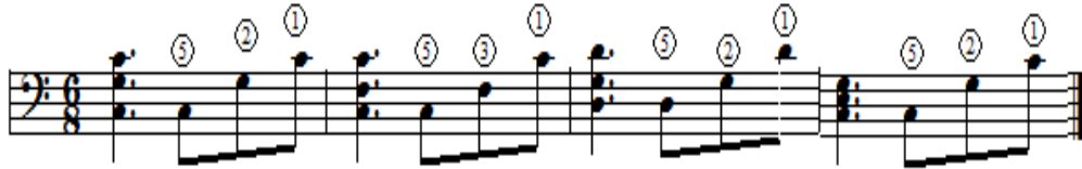
شكل رقم (٩)

يتطلب أدائها استعداد العازف باليد اليسرى وبدون شد لأداء نغمات التألفات المنفرطة وطرق النغمات على البيانو بقوة لمس متساوية، وأن يرفع يده بخفه في نهاية كل قوس لحنى، وتقتصر الباحثة التدريب التالي على أداء نغمات التألفات المنفرطة محذوفة الثالثة في اليد اليسرى.