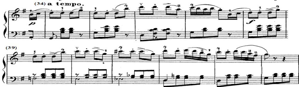
شكل رقم (١٨)

إعادة حرفية للحن الفكرة الأولى من أناكروز (١) - م (٨) في اليد اليمنى مع التطويل، ويلاحظ تغيير الألبرتي باص بمصاحبة اليد اليسرى من م (٣٩) - (٤٤)، والشكل التالي يوضح ذلك.