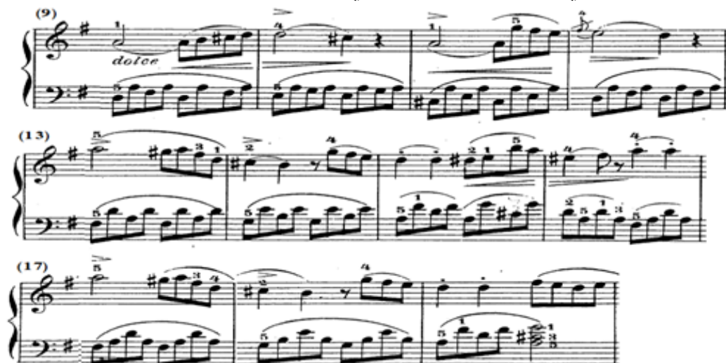
شكل رقم (٣)

ممتدة، وفي العبارة الثانية من م(١٣-١٦) جاء اللحن في اليد اليمنى تصوير وتوزيع للحن العبارة الأولى مع ظهور نغمة وتكرارها متقطعة ميتزو ستكاتو Mezzo Staccato، والعبارة الثالثة من م(١٧-١٩) جاءت إعادة حرفية للعبارة الثانية، وتستمر اليد اليسرى في أداء الألبيرتي باص المتصل مع التصوير في سلم ري/ك، والشكل التالي يوضح ذلك.