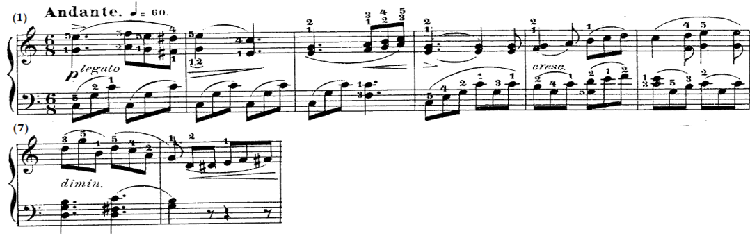
شكل رقم (٨)

جاء اللحن في اليد اليمنى متصل وبطيء في سلم دو/ك قائم على مسافات هارمونية مزدوجة متتالية خاضعة لأقواس لحنية مختلفة الأطوال وتنتهي بنغمات كروماتيكية صاعدة، وجاءت المصاحبة باليد اليسرى في نموذج إيقاعي جديد قائم على نغمات تألف منفرط محذوفة الثالثة ومتصلة تنتهي بتألفات ثلاثية ومسافة هارمونية، والشكل التالي يوضح ذلك.