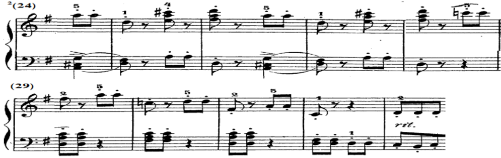
شكل رقم (١٧)

ويصاحبها في اليد اليسرى تألف ومسافة هارمونية خاضعين لقوس لحنى قصير Slur يليهما نغمات مفردة هي تكرر للحن اليد اليمنى أوكتافين أسفل ويتكرر ذلك، وجاء لحن اليد اليمنى في العبارة الثانية من ^2(28) - ^2(33) قائم على نغمات مفردة متقطعة، ويصاحبها في اليد اليسرى تألفات هارمونية متقطعة تنتهي بمسافات هارمونية ونغمات مفردة، والشكل التالي يوضح ذلك.