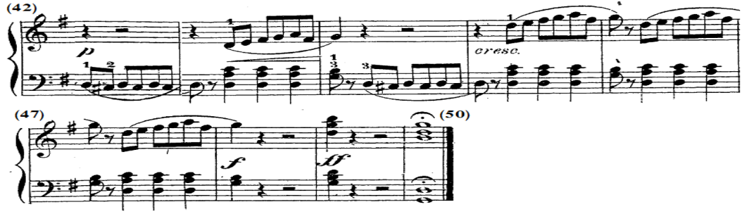
شكل رقم (٧)

الكودا من م(٤٢) - م(٥٠) في الحركة الأولى