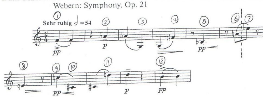
شكل رقم (٣)

كذلك ظهر استخدام الألحان في موسيقا القرن العشرين باتباع الطريقة السريالية أو الإثنى عشرية والمعروفة أيضا بالدوديكاфонية، فالمثال التالي عند فيبرن Webern (١٨٨٣ - ١٩٤٥) يظهر فيه استخدام فيبرن للحن في سلسله لحنية أبعد ما تكون عن التسلسل المنطقي لأي تسلسل لحن (١) .