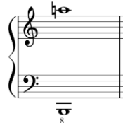
شكل رقم (١٠)

- المسافات اللحنية : استخدمت مسافات لحنية متسعة جدا صعودا وهبوطا خاصة في م (٢٨) مع استخدام قفزات بالأوكتاف والسابعة اللحنية والخامسات والرباعيات الزائدة والناقصة . - الحركة اللحنية مفردة أم مزدوجة : ظهرت الحركة اللحنية بشكل يجمع بين النغمات المفردة والمزدوجة من نغمتين أو من خلال التآلفات الهارمونية من ثلاث نغمات . - المساحة الصوتية : تم استخدام مساحة صوتية في نطاق واسع جدا بالشكل التالي .