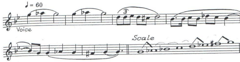
شكل رقم (٤)

Ex. 47 BRITTEN: Serenade—Dirge (1943) p18