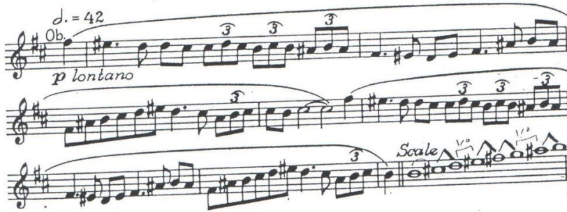
شكل رقم (٥)

- GRIFFES: The Pleasure Dome of Kubla Khan (1919) p16