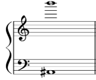
شكل رقم (٩)