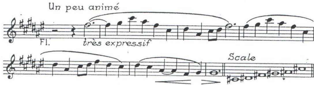
شكل رقم (1)