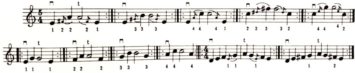
شكل رقم (٢١)

التمرين التالى يوضح ما يقصده صامويل ألبيوم كما فى الشكل رقم (٢١):