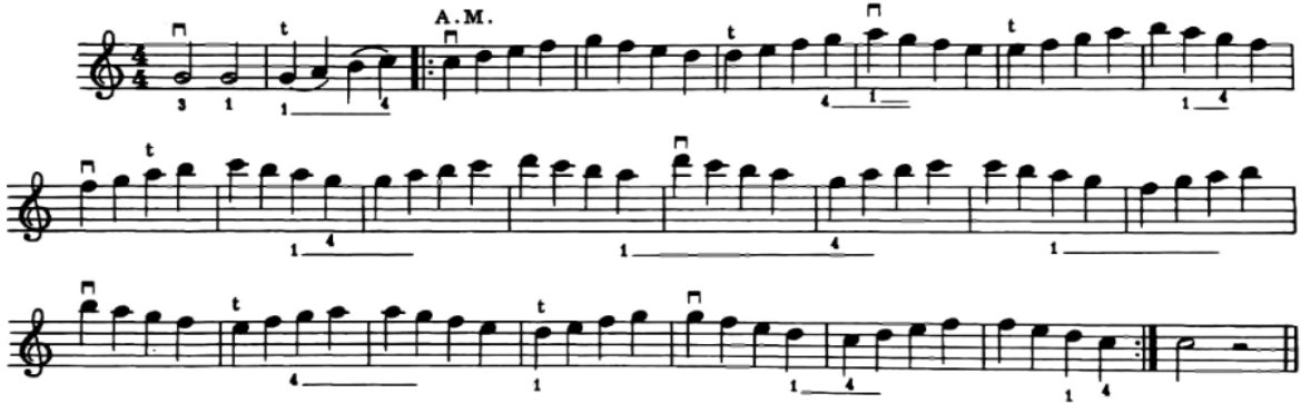
الشكل رقم (٨)

٤- وتطبيقا لما سبق ينصح سامويل ألبليوم بأداء هذه المقطوعة لما تحتويه أرقام الأصابع التى تساعد على الإنتقال من وإلى الوضع الثالث كما موضح فى الشكل رقم (٩):