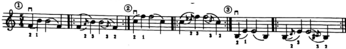
شكل رقم (١٩)

وللتدريب على الإنتقال بالإصبع الثانى الى الإصبع الثالث فى الوضع الثالث ينصح سامويل ألبليوم بالتمرين التالى (شكل رقم ١٩):