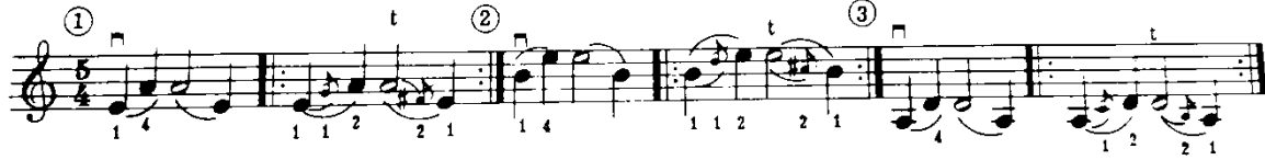
شكل رقم (١٦)

وينصح سامويل ألبليوم بإستخدام الإنتقال بالأصبع الأول إلى الإصبع الثاني فى الوضع الثالث من خلال التمرين التالى (شكل رقم ١٦):