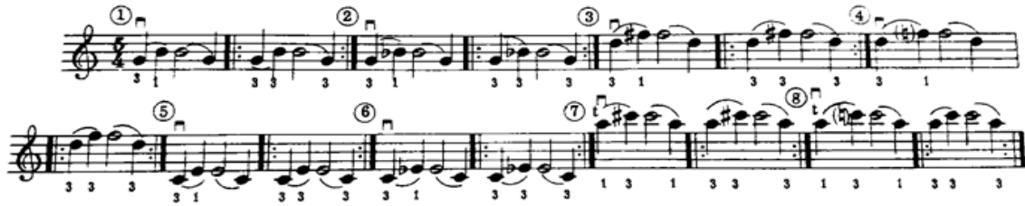
شكل رقم (١٤)

المثال الثالث: الإنتقال بالإصبع الثالث من والى الوضع الثالث ، كما موضح فى الشكل رقم (١٤):