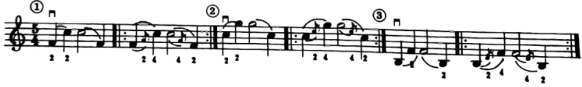
شكل رقم (٢٠)

وللتدريب على الإنتقال بالإصبع الثانى الى الإصبع الرابع فى الوضع الثالث ينصح صامويل ألبيوم بالتمرين التالى (شكل رقم ٢٠):