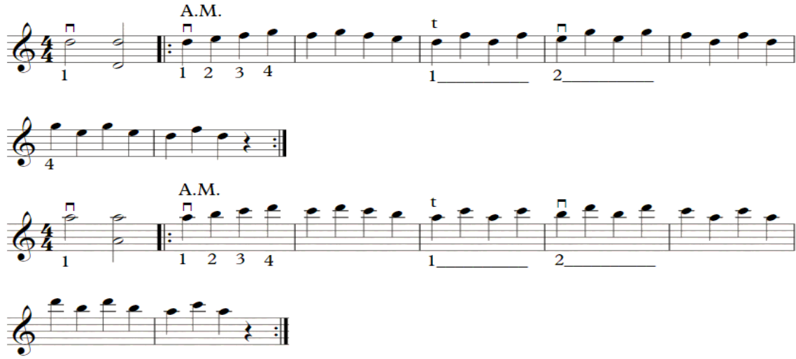
شكل رقم (٤)

٣- الإنتقال من وتر لآخر فى الوضع الثالث: