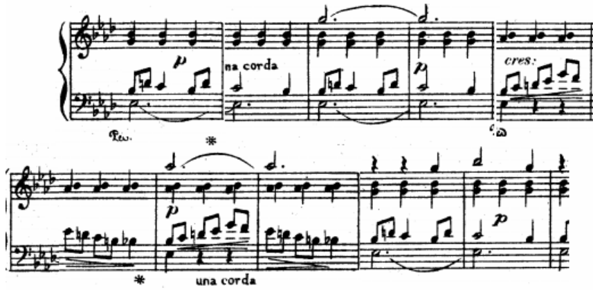
شكل رقم (٣) يوضح الجملة الخامسة م: (٣٣): م: (٤١)

الجملة السادسة : من م (٤١ : ٤٨) وتنتهي بقفلة نصفية في سلم لا b ك، تكرار للجملة السابقة مع التنويع من خلال زيادة الكثافة الهارمونية وظهور لحن أفقي في صوت السوبرانو باليد اليمنى واستعان المؤلف بالمصطلحات التعبيرية (marcato) للتأكيد على ظهور النغمات أكثر وضوحاً في صوت السوبرانو.