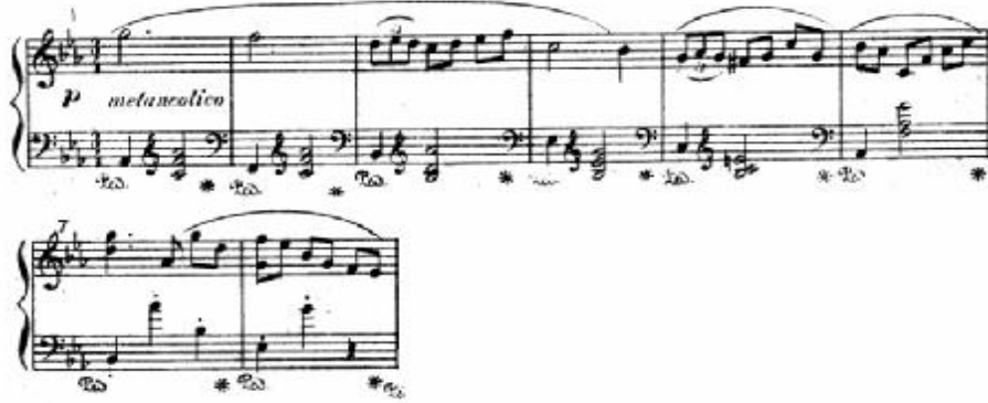
شكل رقم (٧) يوضح نموذج للجملة الأولى م(١):م(٨)

الجملة الأولى: من م(٨:١) تنتهي بقفلة تامة في سلم مي الكبير، جملة منتظمة، مبنية على استخدام النماذج الإيقاعية البسيطة في حدود النوار والكروش، وظهور نغمات ممتدة بزمّن البلاش المنقوت (---) في الصوت الخارجي مع تسلسل لنغمات منفردة في اليد اليمنى واليسرى، والمصاحبة تبدأ بنغمة منفردة يليها تألف هارموني واستعان المؤلف بالدواس الأيمن السينكوبي لضمان الأداء المترابط، كما استخدم التغيير المتعدد للمفاتيح في نطاق المازورة الواحدة .