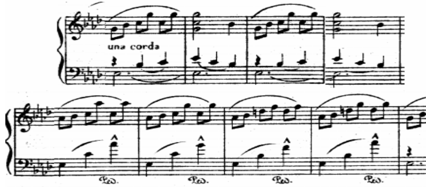
شكل رقم (٢) يوضح الجملة الثالثة

الجملة الثانية: من م(٩) : م(١٨) هي تكرار للجملة السابقة مع التنويع من خلال زيادة الكثافة الهارمونية في اليد اليمنى وظهور اشارات المرجع م(١٥،١٦)، وتنتهي بقفلة تامة في سلم (لا b ك) الجملة الثالثة: منتظمة تبدأ من م(١٧ : ٢٥) وتنتهي بقفلة نصفية في سلم (لا b ك) تعتمد على ظهور النغمات الأربيجية في صوت السوبرانو باليد اليمنى مع مصاحبة على شكل نغمة ممتدة في الصوت الخارجي باليد اليسرى وظهور نغمات كنترابوناتية في الصوت الداخلي في نفس اليد. تتسم بالأقواس اللحنية القصيرة والمصطلحات الدالة على استخدام الدواس الأيسر (Una corda) للحد من ترددات عزف النغمات الأربيجية في اليد اليمنى خط اللحني في الصوت الداخلي لليد اليسرى، والعلامات الدالة على النبر المفاجئ الغير منتظم في اليد اليسرى.