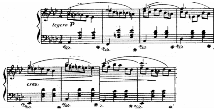
شكل رقم (1) يوضح نموذج الجملة الأولى م (١): م (٨)

الجملة الأولى: من م (٨:١) تنتهي بقفلة تامة في لا b الكبير، جملة منتظمة، مبنية على استخدام النماذج الإيقاعية البسيطة في حدود النوار والكروش، وظهور نغمات ممتدة بزمن البلانش المنقوطة (.-.) في الصوت الخارجي مع تسلسل كروماتيكي لنغمات منفردة في اليد اليمنى، والمصاحبة تبدأ بنغمة منفردة يليها تآلف هارموني واستعان المؤلف بالدواس الأيمن السينكوبي لضمان الأداء المترابط، كما يوضحه الشكل التالي: