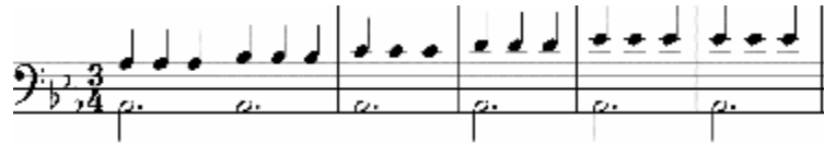
شكل رقم (١١) يوضح تمرين لتوسيع اليد

* نغمة ممتدة مع نغمات منفردة مكونة مسافة واسع مكونة بعد اثني عشر وتعد هذه صعوبة خاصة لذوي الأيدي الصغيرة وتقتصر الباحثة الاستعانة بالتدريب الخاص بتوسيع اليد.