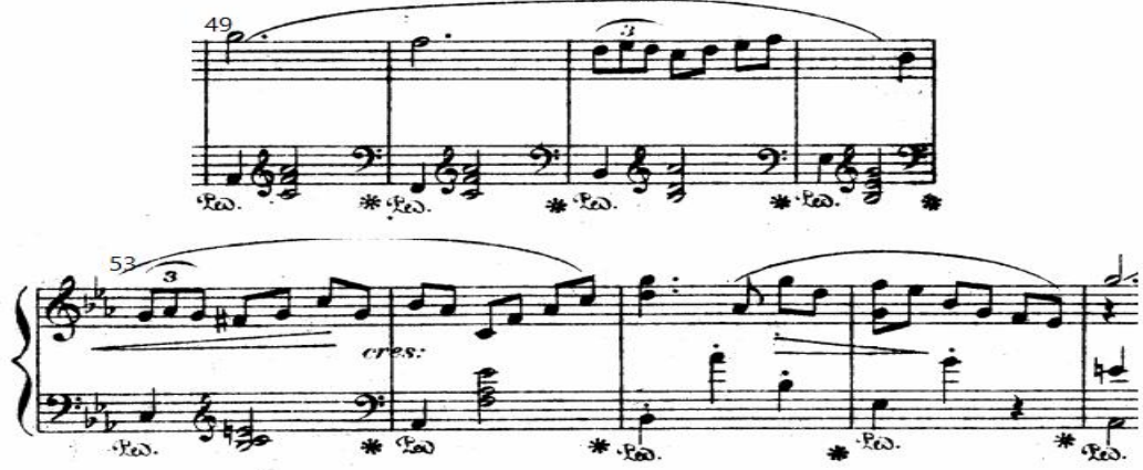
شكل رقم (٩) يوضح نموذج للجملة السابعة م(٤٩):م(٥٦)

الجملة السابعة: يبدأ من م(٤٩): م(٦٤) وتنتهي بقفلة تامة في سلم(مي ٧ /ك). وهي مبنية على النغمات الممتدة مع نغمات منفردة ذات مساحات متنوعة مكونة مسافات واسعة، مع ظهور الأقواس اللحنية المتنوعة .