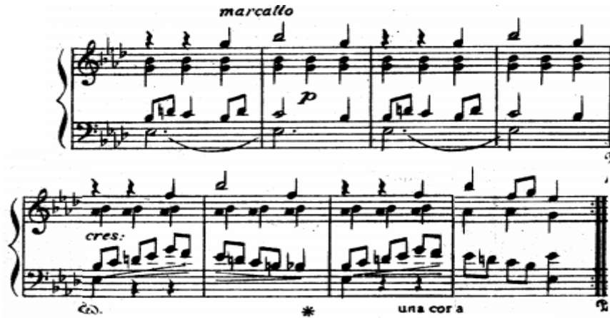
شكل رقم (٤) يوضح الجملة السادسة

الجملة السادسة : من م (٤١ : ٤٨) وتنتهي بقفلة نصفية في سلم لا b ك، تكرار للجملة السابقة مع التنويع من خلال زيادة الكثافة الهارمونية وظهور لحن أفقي في صوت السوبرانو باليد اليمنى واستعان المؤلف بالمصطلحات التعبيرية (marcato) للتأكيد على ظهور النغمات أكثر وضوحاً في صوت السوبرانو.