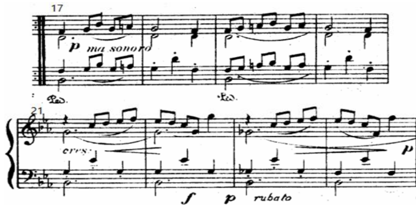
شكل رقم (٨) يوضح نموذج للجملة الثالثة م(١٧):م(٢٤)

الجملة الثانية: من م(٩) : م(١٨) هي تكرار للجملة السابقة مع التنويع من خلال زيادة الكثافة الهارمونية في اليد اليمنى. وظهور تنوع في استخدام المفاتيح وتنتهي بقفلة تامة في سلم (لا b ك). الجملة الثالثة : منتظمة تبدأ من م(١٧ : ٤٨) وتنتهي بقفلة نصفية في سلم (مي / ك) وهي عبارة عن جملة موسيقية ويتم تكرار هذه الجملة ثلاث مرات. تعتمد على ظهور النغمات الممتدة في صوت الداخلي باليد اليمنى والخارجي في صوت الباص في اليد اليسرى وظهور نغمات كنترابوناتية في الصوت الخارجي في اليد اليمنى. تتسم بالأقواس اللحنية القصيرة والمصطلحات التعبيرية كما يوضحه الشكل التالي: