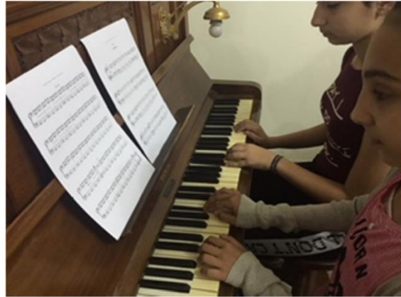
شكل رقم (٤) اداء العزف الثنائي

و همت الناحية الاطفال الى الحلو س، الصحيح بكون العازف الاول على، يسار مفتاح دو الوسط، و العازف الثاني، على، يمين، دو الوسط، و تفضل الناحية ان، بحلو، كل عازف علي مقعد منفرد وذلك لأنه يساعد علي حرية الحركة اكثر اثناء الاداء كما في الشكل التالي