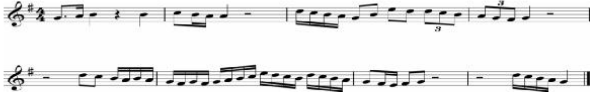
نموذج رقم (٧) سكتات إيقاعية