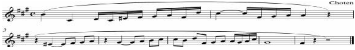
نموذج رقم (٣) جملة غير منتظمة