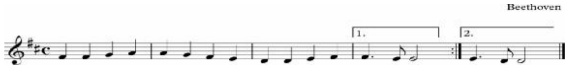
نموذج رقم (٤) جملة منتظمة