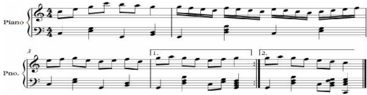
نموذج رقم (١٠) جملة تؤدي القفلة فيها حركياً

الموقف الثاني: طابع موسيقى الشعوب المختلفة وبعض الآلات الموسيقية