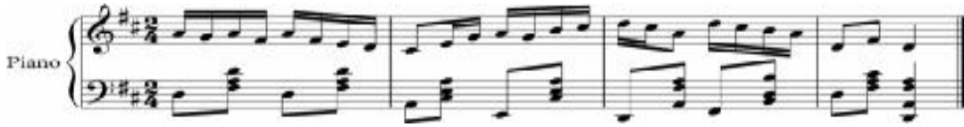
نموذج رقم (٩) قفلة تامة