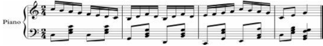
نموذج رقم (٨) قفلة نصفية

إلى أعلى (كمحاولة الوصول إلى نقطة بعيدة) تعبيراً عن التطلع وعدم الاستقرار، وإذا استمعوا لقفلة تامة فتؤدي نفس الحركة ولكن باستبدال مد الذراع بالجلوس القرفصاء مع تخبئة الرأس باليدين تعبيراً عن الانتهاء والاسترخاء كما في النماذج التالية: