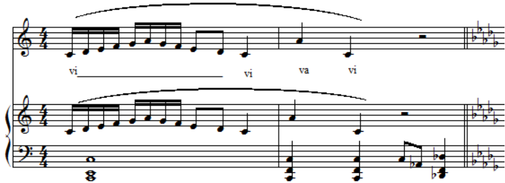
شكل رقم (٢)