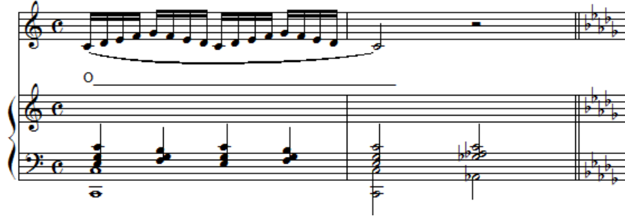
شكل رقم (٣)

١٤- الاستعانة بالتدريب الصوتى التالى قبل تكرار الغناء :