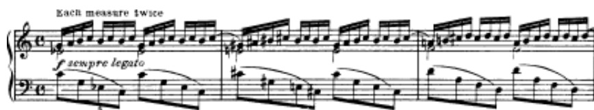
شكل يوضح تمرين رقم (١٩)

تمرين رقم ١٩ انقل تثبيت النغمات لليد اليمنى مع ايقاع \text{♩} وتثيب البلاننش لكل اثنين ايقاع مع التحويلات المتكرره للأداء في سلام متنوعه وقوس قصير يربط نهاية كل مازورة بما يليها أما اليد اليسرى تؤدي ايقاع \text{♩} في صورة أريجات هابطة ثم صاعدة بشكل مترابط على التوالي مع تغيير مفتاح الأداء م (٢٢،١٠) .