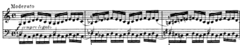
شكل يوضح تمرين رقم (٧)

تمرين رقم ٧ زيادة السرعة الايقاعية باليدين معافى أداء نغمات سلمية يتخللها بعض المسافات البسيطة بايقاع \text{♩} في اتجاه معاكس لليدين مع تثبيت لنغمات البلاننش باليد اليسرى لكل مازورة .