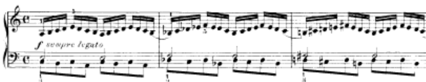
شكل يوضح تمرين رقم (٦)

تمرين رقم ٦ أداء نفس السلام الصغيره لتمرين رقم ٥ ولكن بمضاعفة السرعة لليدين ويرتكز الأداء لليد اليمنى بينما تؤدي اليد اليسرى نغمات الأساس وأصوات ممتدة بأستخدام علامة البلاننش لكل اثنين نوار .