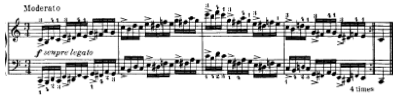
شكل يوضح تمرين رقم (٢٩)

تمرين رقم ٢٩ التدريب فى سلالم متنوعه بأستخدام علامات تحويل فى كل مازورة على حده وميزان \frac{3}{4} مع العزف القوى (F) المتصل بسرعه متوسطة حيث تؤدى اليدين معا "نغمات متماثلة صعودا وهبوطا فى اتجاه واحد على ايقاع \frac{3}{4} والضغط بقوة الأكستنت < فى بدء كل علامة ايقاعية .