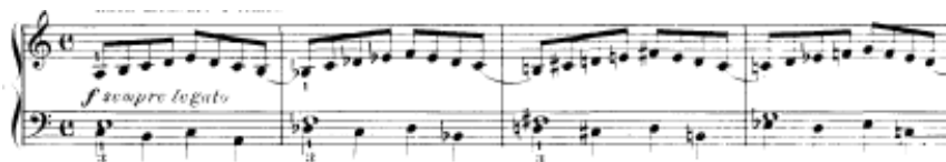
شكل يوضح تمرين رقم (٥)

تمرين رقم ٦ أداء نفس السلام الصغيره لتمرين رقم ٥ ولكن بمضاعفة السرعة لليدين ويرتكز الأداء لليد اليمنى بينما تؤدي اليد اليسرى نغمات الأساس وأصوات ممتدة بأستخدام علامة البلاننش لكل اثنين نوار .