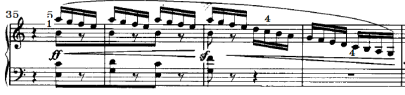
شكل رقم (١٠) تتابع سلمى هابط لمسافتي أكثر من ٢ أكتاف